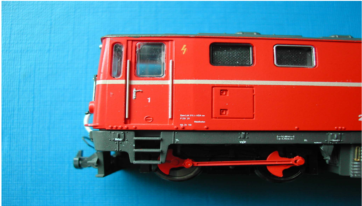
Lokomotive Baureihe 2095 vor den Umbau

Beim Kauf einer H0e Diesellok Baureihe 2095 von Fa.Stängl oder Fa.Dolicho habe ich festgestellt die Griffstangen bei den Führstandtüren sind nur angespritzt. Diesen Umstand zufolge wollte ich diese Griffstangen auf neue passende Griffstangen ersetzen und nun zu den Arbeitsschritten für den Umbau.