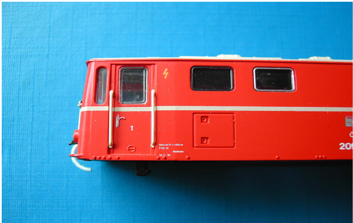
Gehäuse nach anbringen der Griffstangen und Lackierung

Nach den herauslösen der Griffstangen aus dem Spritzlingteil werde diese noch entgratet und vorbereitet für die Verklebung. Zum verkleben wird Superkleber Toolcraft Rapid 150 verwendet, beim kleben ist darauf zu achten das nicht zuviel Kleber auf die Griffstangen kommt. Tip einen Tropfen Superkleber mit einen Zahnstocher auf eine nicht saugende Fläche geben, danach kann man die Griffstange an den Klebefläche exakt eintauchen und danach auf das Gehäuse aufkleben.