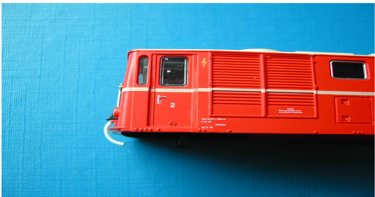
Gehäuse nach entfernen der Griffstangen sowie Lackierung

Mit feinen Graveurstichel oder scharfen Messer werden die erhabenen Griffstangen entfernt, danach werden die neuen Flächen mit den entsprechenden Lack nachlackiert.